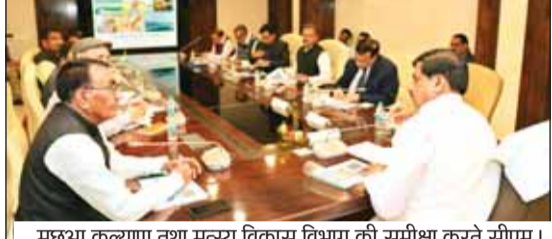
मछुआ कल्याण तथा मत्स्य विकास विभाग की समीक्षा करते सीएम।

उन्होंने कहा कि राज्य सरकार मत्स्य पालकों के कल्याण के लिए प्रतिबद्ध है। इसके लिए प्रदेश में मछली पालन के साथ ही एक्वाकल्चर के क्षेत्र में भी कार्य किया जाए। प्रदेश में ऐसा इको सिस्टम तैयार किया जाए, जिससे मछुआरों का आर्थिक सशक्तिकरण हो सके। डॉ. यादव ने मंगलवार को मंत्रालय में मछुआ कल्याण तथा मत्स्य विकास विभाग की समीक्षा बैठक में अधिकारियों को यह निर्देश दिए।