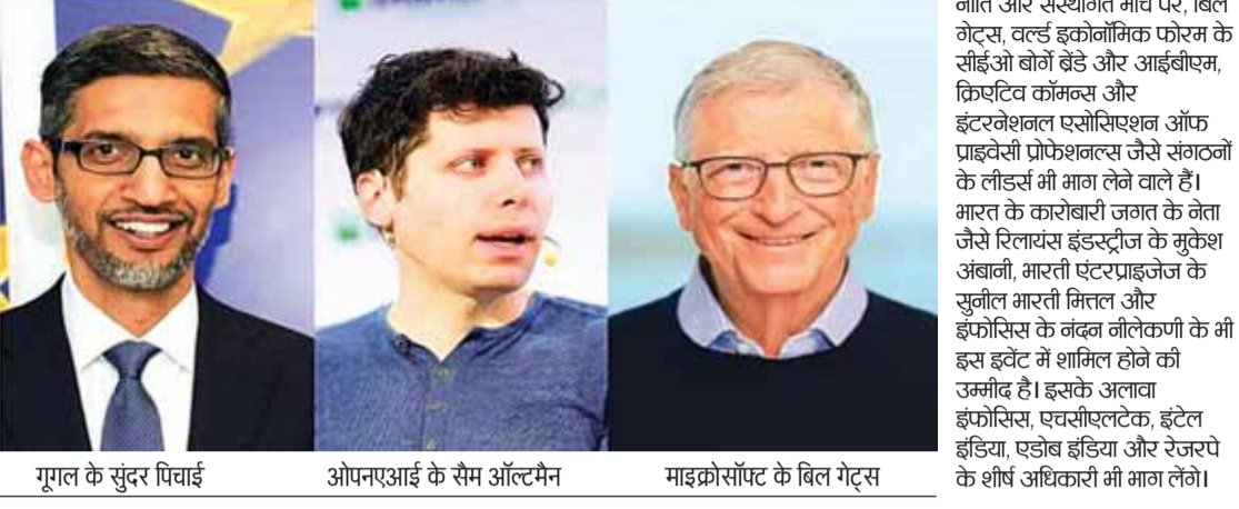
गूगल के सुंदर पिचाई, ओपनएआई के सैम ऑल्टमैन, माइक्रोसॉफ्ट के बिल गेट्स

एआई क्रांति टेक इंडस्ट्री के हर क्षेत्र में प्रगति के व्यापक अवसर प्रदान करेगी एआई की मदद से काम, आर्थिक और तकनीकी तरक्की का बढ़ावा देना है