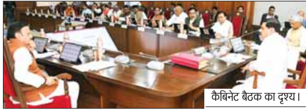
कैबिनेट बैठक का दृश्य।

मण्डल को शुल्क की प्रतिपूर्ति, एससी-एसटी के अभ्यार्थियों को छात्रवृत्ति, कक्षा-9 वीं की छात्रवृत्ति के लिए 522 करोड़ 8 लाख की स्वीकृति प्रदान की