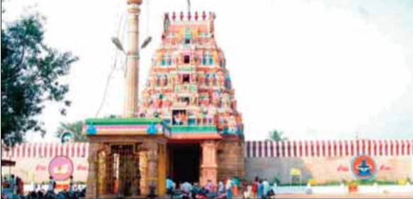
कोयम्बटूर के धार्मिक स्थलों में से एक, 11वीं शताब्दी का पेठर पाटेश्वर विर्मित मंदिर राजा करिकाल को दान बजाया गया था। शिव को स्वयंभू लिंगम के रूप में, पीठासीन देवता, पटेश्वर के रूप में पूजा जाता है।