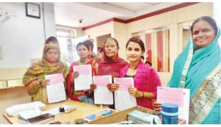
संगठक भी सक्रिय रूप से लगे हुए हैं, ताकि अधिक से अधिक हितग्राहियों को राहत लोन उपलब्ध कराया जा सके। इंडियन बैंक, लालमाटी शाखा ने एक ही दिन में 20 हितग्राहियों के आवेदन प्रक्रिया को पूरा कर उन्हें सीधे खातों में ऋण राशि हस्तांतरित कर दिया। निगमायुक्त आर.पी. अहिरवार ने इस तत्परता की सराहना करते हुए शहर के अन्य बैंकों से भी आग्रह किया कि वे इसी सक्रियता के साथ अधिक से अधिक छोटे कारोबारियों को लाभान्वित करें। निगमायुक्त ने यह भी बताया कि हितग्राही अपनी नजदीकी संभागीय कार्यालयों में संपर्क कर योजना का लाभ प्राप्त कर सकते हैं। इस पहल से शहर के छोटे कारोबारियों की राह आसान होने के साथ उन्हें आत्मनिर्भर बनने का मार्ग भी प्रशस्त हुआ है।

जबलपुर। शहर के स्ट्रीट वेंडर्स और छोटे कारोबारियों को आर्थिक रूप से सशक्त बनाने के लिए जबलपुर नगर निगम पूरी सक्रियता से जुटा हुआ है। निगमायुक्त आर.पी. अहिरवार के अथक प्रयास और बैंकों के सकारात्मक सहयोग से पी.एम. स्वनिधि योजना का लाभ सीधे पात्र हितग्राहियों तक पहुंच रहा है। निगमायुक्त और उपायुक्त श्रीमती अंकिता जैन ने बताया कि योजना को गति देने के लिए वे बैंकों में जाकर हितग्राहियों और बैंक प्रतिनिधियों से सीधे संवाद कर रहे हैं। इस कार्य में सिटी मिशन मैनेजर और सामुदायिक