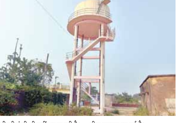
पानी की टंकी भी नहीं भर पा रही है। बताया जाता है कि लगभग 1 दशक पूर्व 50 लाख की लागत से पड़तला तिरगड्डामें इस टंकी का निर्माण किया गया था प्रारंभ में तो कुछ समय तो यह टंकी भरी गई किंतु समय बीतने के साथ-साथ यह टंकी का उपयोग न होने के कारण यह शोपीस बनकर रह गई है।