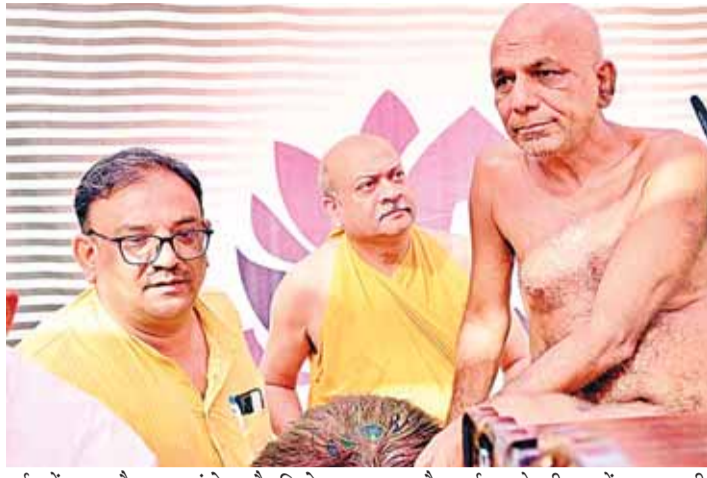
धर्म हमें सुख और दुःख, संयोग और वियोग, इष्ट अनिष्ट, हानि लाभ, मान अपमान, तथा अन्य संकटों के क्षणों में स्थिरता प्रदान करता है, धर्म हमारे जीवन में मकान की रींवाक के समान है जो बड़ी से बड़ी हवेली को स्थिरता प्रदान करती है यदि उस नींव को हटा दिया जाये या नींव ही कमजोर हो तो वह मकान टिक नहीं सकता उसी प्रकार जिसके जीवन में धर्म नहीं है, उसके जीवन में कभी स्थिरता नहीं आ सकती धर्म अर्थात् तत्वज्ञान की सही समझ, वस्तु स्वरूप का ज्ञान जिसको होता है वह मुसीबतों से कभी घबराहट महसूस नहीं करता मुनि श्री ने कहा कि एक धर्म के जीवन में सही समझ, सही दिशा, संयम और संतोष रहता है, इसलिये वह कभी संकटों से रोता बिलखता नहीं, न ही वह घबराहट महसूस करता क्योंकि वह जानता है कि यह सब कर्म जनित संयोग वियोग है जहां समझ है वही स्थिरता है, उन्होंने कहा कि बोलो इस दुनिया में कोई भी एक आदमी है, जो यह कह सके कि मैं पूर्ण संतुष्ट और सक्षम हूँ, कि मेरे जीवन में कभी दुःख आ ही नहीं सकता? हां ऐसा व्यक्ति जरूर मिल सकता है जो यह