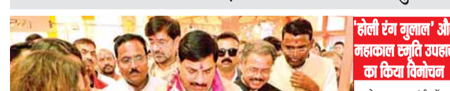
'होली रंग गुलाल' और महाकाल स्मृति उपहार का किया विमोचन

श्री महाकाल वन मेले का सीएम डॉ. यादव ने किया शुभारंभ